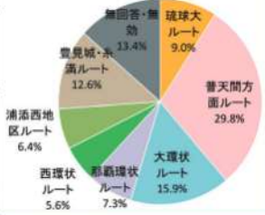
2019年、マイカー運転者から得た モノレール延伸希望アンケート結果